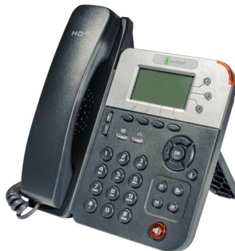
Outra posição de apoio para mesa.